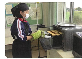
生活文化科(高等部)