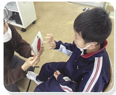
教科学習・国語(小学部)