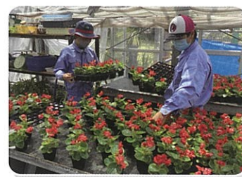
産業技術科(高等部)