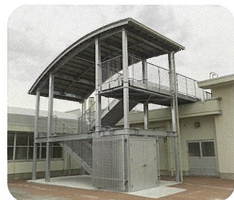
津波避難用屋外階段