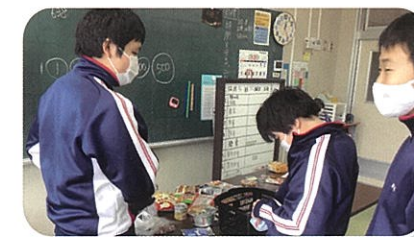
教科学習・数学(中学部)