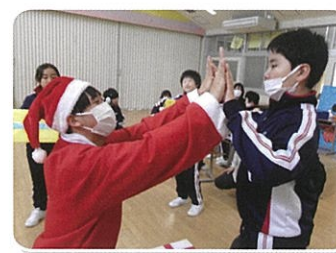
遊びの指導(小学部)