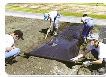
産業技術科(高等部)