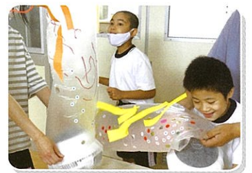
遊びの指導(小学部)