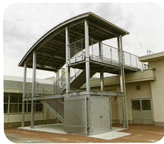
津波避難用屋外階段