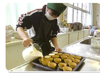
生活文化科(高等部)